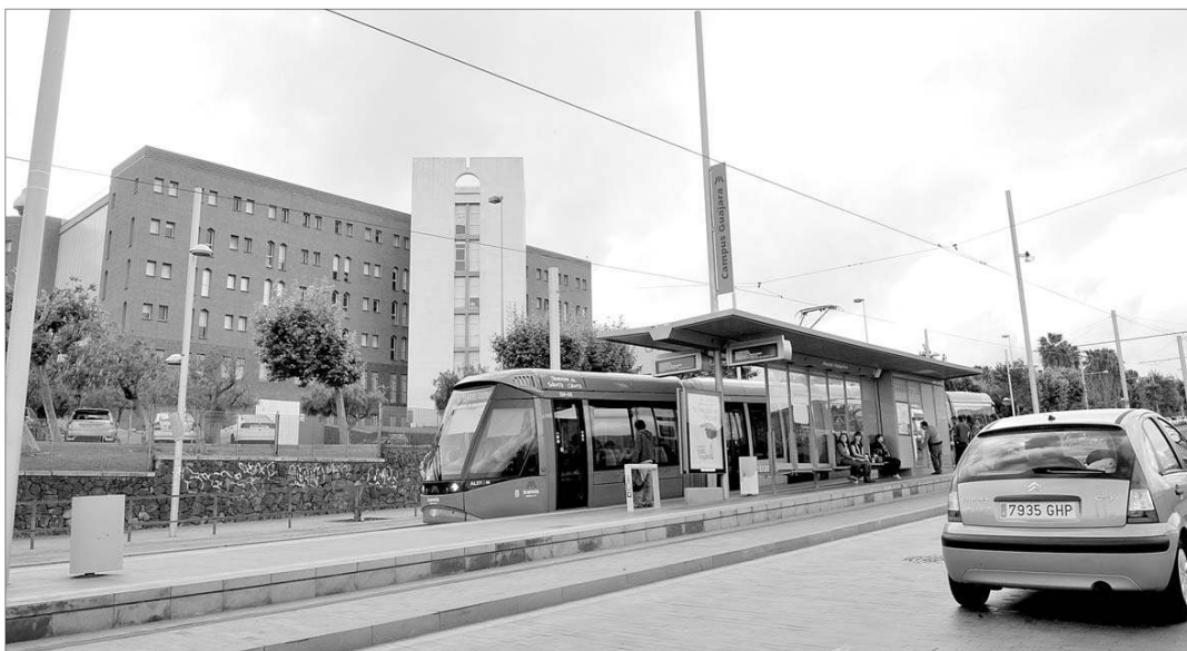
EL TRANVÍA SE HA AJUSTADO A LAS EXPECTATIVAS QUE YA TENÍAN LOS ALUMNOS EN 2007, según el nuevo estudio realizado por la ULL.