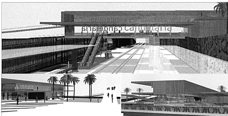
LAS ESTACIONES DE SANTA MARÍA DEL MAR-AÑAZA (IZQ.) Y CANDELARIA estarán dotadas con 1.100 y 800 aparcamientos, respectivamente, para vehículos privados.