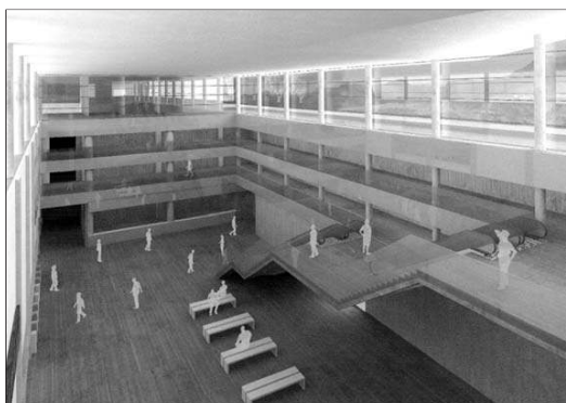
LA ESTACIÓN DE LOS CRISTIANOS estará completamente soterrada.