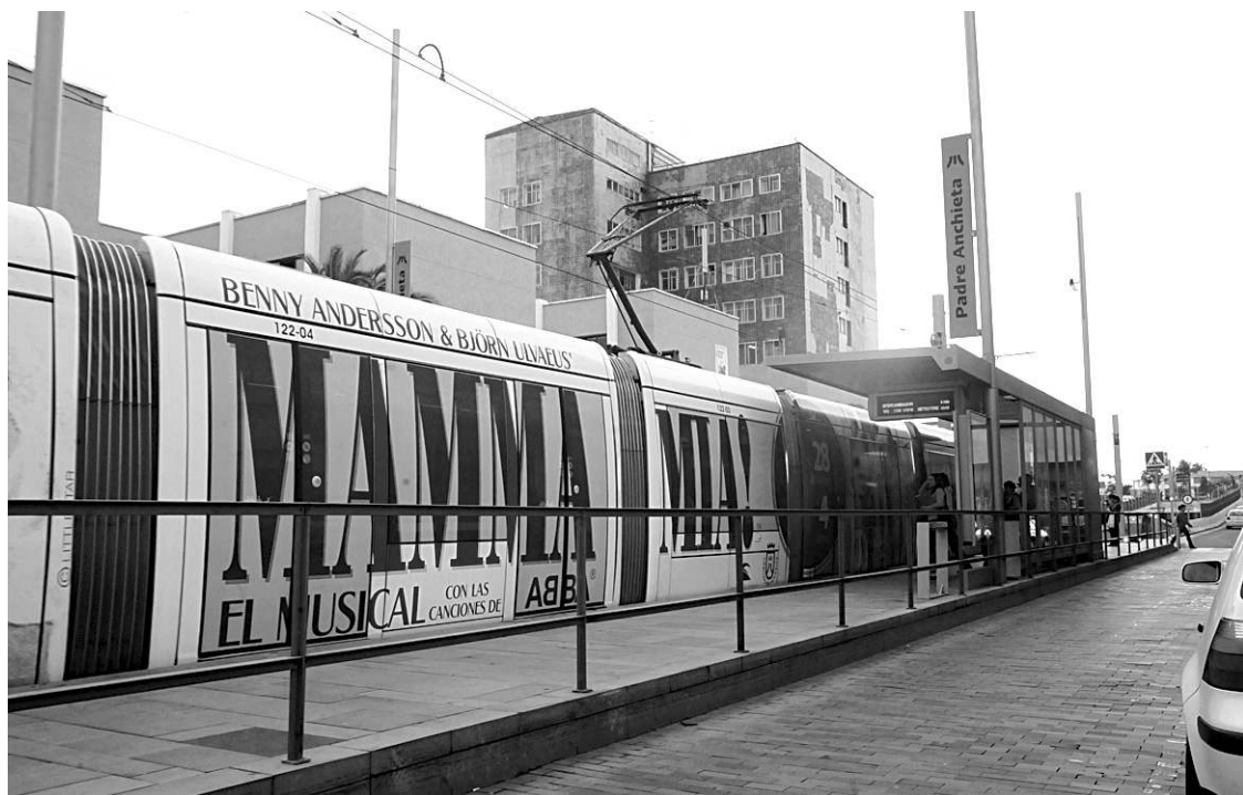
La parada actual se encuentra en la entrada a la avenida de La Trinidad, junto a la Universidad.