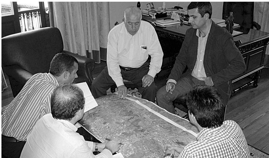
Imagen de archivo de la presentación del trazado del tren a varios alcaldes del Norte.

“Estamos con la fase final de consultas en el avance y la propuesta que hacemos del Plan la elevaremos al Consejo de Gobierno - al ser este el órgano competente en este caso y no el Pleno de la Corporación insular - y lo llevamos a aprobación el 30 noviembre, después de que se informe en comisión a los grupos políticos”, afirmó Alonso. Una vez la Corporación insular